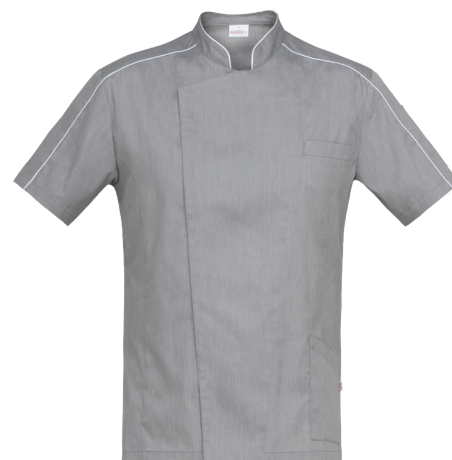
019 Grigio chiaro