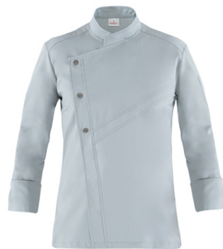
019 Grigio chiaro