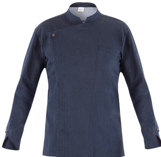
J004 Jeans blu