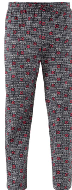
F020 G' horeca