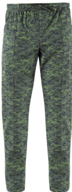
F019 Camouflage pixel