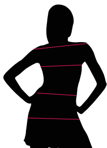
TABELLE TAGLIE E CORRISPONDENZE